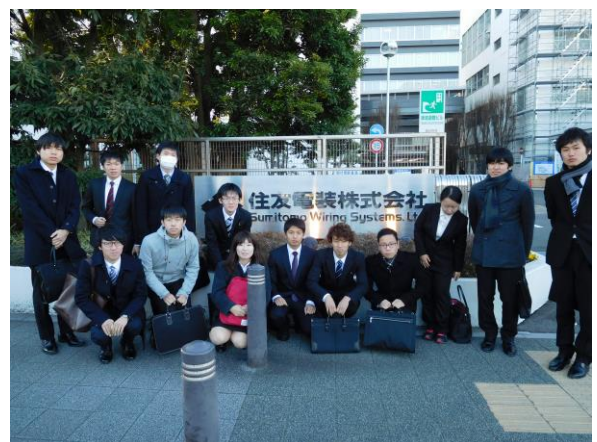
住友電装株式会社 四日市製作所 見学会参加者

これまで明瞭に意識したことのない製品や製品の役割の重要性や製品が成り立っていく現場を見学させていただき、今後の機械工学の修学や就職に役立つ、とても有意義な機会でした。