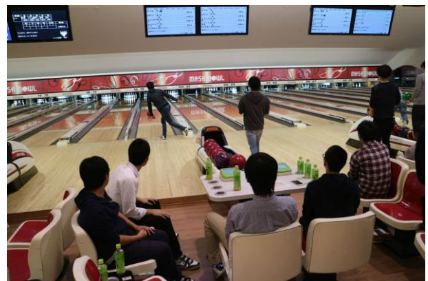
第46回畠山杯争奪ボーリング大会

会場を医学部食堂に移して,表彰式,研究交流会,懇親会を行いました.表彰式では歴史ある優勝トロフィーが渡され,懇親会で大きなジョッキと化していました.今回の研究交流会では8件の研究紹介がポスターを使って行われ,各校の機械科の様々な研究内容を知る機会となりました.