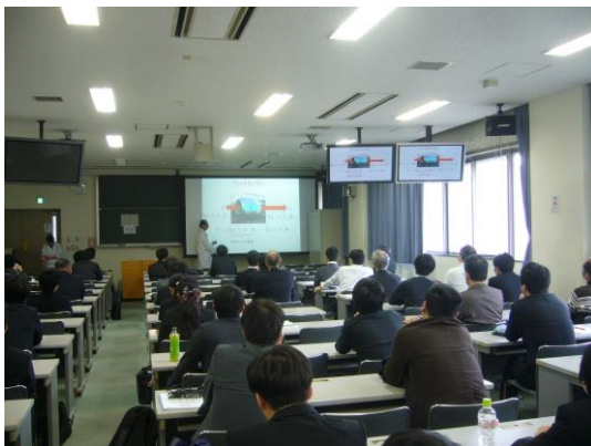
学生向けワークショップ

同日開催の「メカナビ東海 企業・学生キャリア懇談会」において,和やかな雰囲気の中で表彰式が行われました.